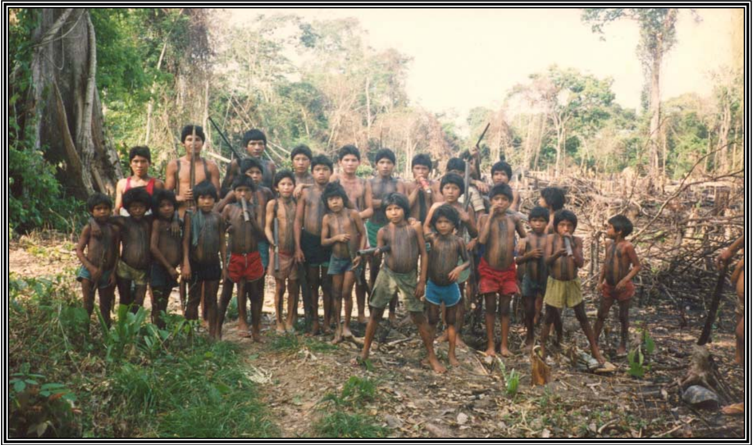
Homens Parakanã preparados para festa