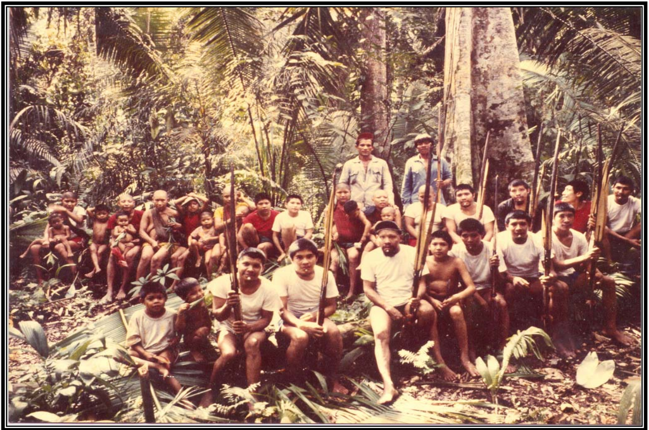
Parakanã do Xingu à época do contato