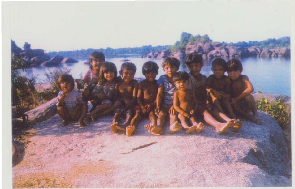
Mulheres e crianças Parakanã