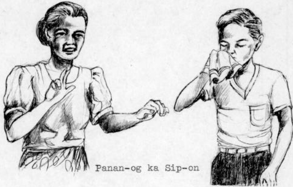
Panan-og ka Sip-on