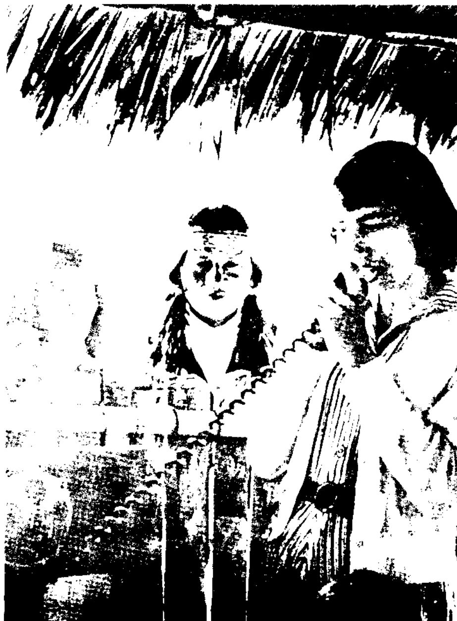
Tadidi ne Momtsansi