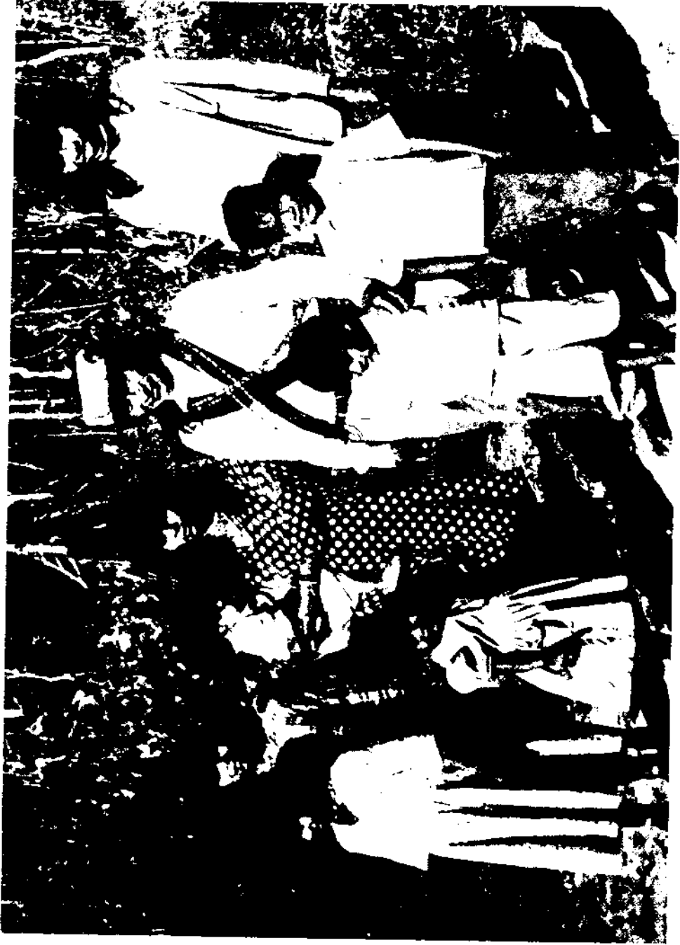
Tadidi ne kem fes lówóhen