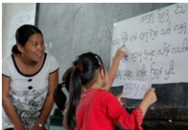
On apprend plus facilement à lire dans la langue que l'on parle le mieux.

Quand les élèves débutent l'école primaire dans leur langue maternelle, ils apprennent plus rapidement à lire, écrire et compter. Ils transfèrent ensuite facilement les compétences de lecture et d'écriture acquises dans leur langue dans la langue officielle de l'enseignement, ayant ainsi des outils essentiels pour continuer d'apprendre leur vie durant. Il en résulte qu'ils ont une meilleure image d'eux-mêmes et que leur ethnie est mieux préparée à savoir lire et écrire dans une langue de grande diffusion.