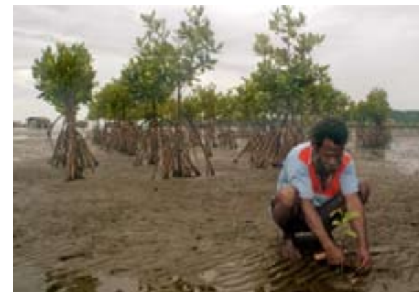
Pendant un programme de Langue maternelle et Développement, les habitants d'un village ambai en Papouasie indonésienne ont appris que l'érosion du sol était due à la destruction de la mangrove.

Dans les programmes de Langue et Développement, des ouvrages informent des principes de protection de la nature. Quand la population locale apprend des techniques adaptées tout en gardant sa connaissance traditionnelle de la flore et de la faune, elle répond à ses besoins économiques tout en préservant l'environnement.