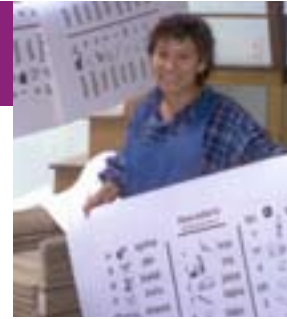
Les élèves comprennent les concepts de lecture grâce à l'alphabet quechua et des tableaux de mots, même quand ceux-ci sont employés dans des classes où l'espagnol est la langue d'enseignement.

Le travail de Langue et Développement consiste en une série d'actions durables planifiées, entreprises par une ethnie pour s'assurer que sa langue continue de répondre à ses besoins sociaux, culturels, politiques, économiques et spirituels en évolution ainsi qu'à ses objectifs dans ces domaines.