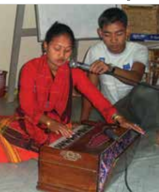
El armonio es un instrumento popular en Bangladesh.