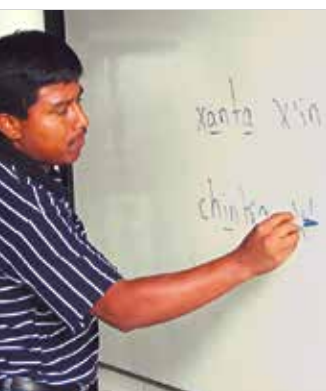
Los participantes aprenden a pasar con confianza a otros lo que han aprendido, asumiendo el liderazgo para documentar y preservar su herencia lingüística y cultural.