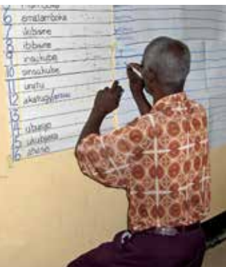
Los participantes en el taller usan su conocimiento del idioma en ejercicios de análisis.

El desarrollo de la ortografía para los hablantes del idioma kuy de Camboya tiene que vencer los desafíos de un inventario fonémico amplio, la compleja escritura jemer y el hecho de que pocos hablantes del kuy tienen una habilidad adecuada en la lectura de ese alfabeto. A pesar de esas complicaciones, la contribución y la participación de la comunidad en el proceso han sido significativas. Reuniones de concienciación del idioma, un taller de ortografía y un comité lingüístico forman una buena base para que los hablantes del idioma kuy adopten su nuevo sistema de escritura.