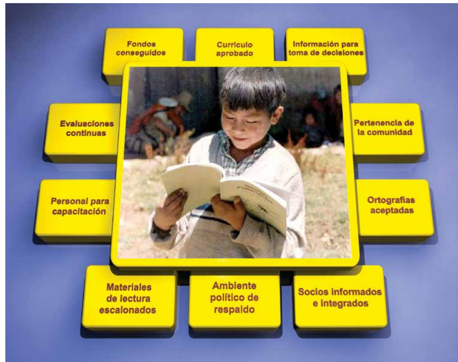
Diagrama por Susan E. Malone, Ph.D www.sil.org/sites/default/files/files/mle_chart.pdf

Los programas de EML requieren de ideas innovadoras y de la cooperación entre las personas, las comunidades, las organizaciones y las agencias. El diagrama muestra los componentes esenciales de los programas más sólidos.