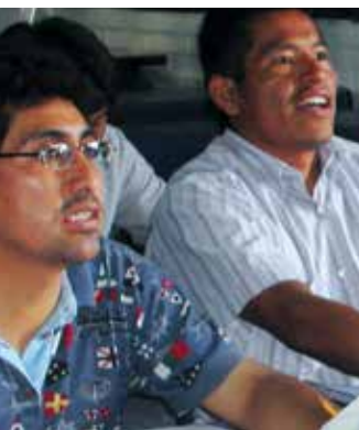
Todos los días los estudiantes y los maestros aprenden algo nuevo.

GUATEMALA—Niños de Guatemala ven un vídeo en ixil “Mi idioma del corazón”, escrito y filmado por un equipo ixil. Fue preparado para enseñar a los ixiles a leer en su idioma. Este equipo local ahora escribe, filma y edita sus propios vídeos, y sus miembros están dispuestos a ayudar a otros a hacer lo mismo.