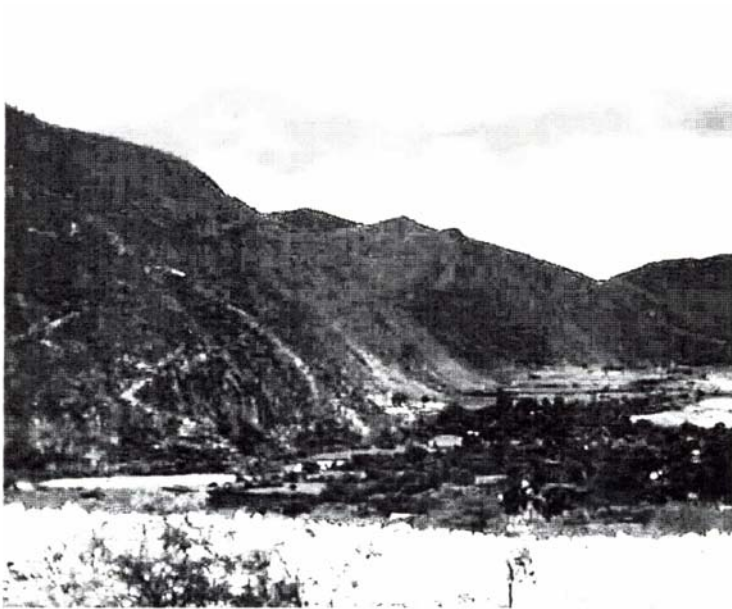
Ñuu Sa Jua

Te ni ka kuu inuu jnu'u te, te ni ka ndadama te divi ñuu xa'a, te ni ka danani te: Sa Jua Teita.